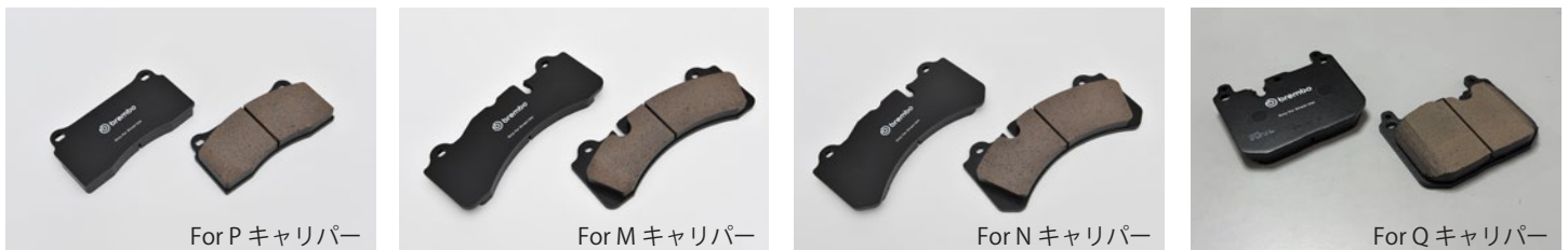
※画像はイメージです。実際の製品は異なる場合がございます。

カルフォルニアとワシントンで導入されている「低銅」を示す新しい基準、LEAF MARKの「N」に準拠した、最高ランクの環境性能を有しています。安心・安全な制動力を維持しつつ、ホイールの汚れを極限まで低減し、ローターのロングライフにも貢献します。