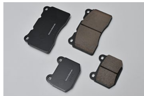
※画像はイメージです。実際の製品は異なる場合がございます。